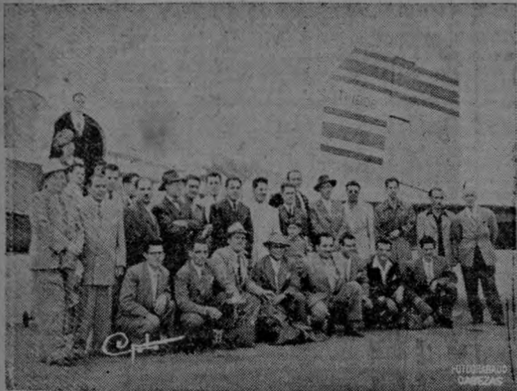
En el grabado aparecen los Excursionistas, en el momento de tomar el avión, rumbo a Buenos Aires

El 21 del presente mes de febrero, partieron para Buenos Aires, República Argentina, veintidós costarricenses, con el fin de asistir a los grandes Juegos Panamericanos que se celebran en ese país.